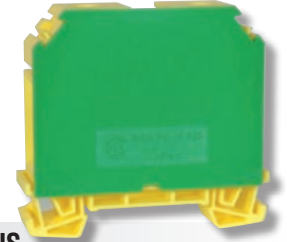
RSA PE 35 A IS